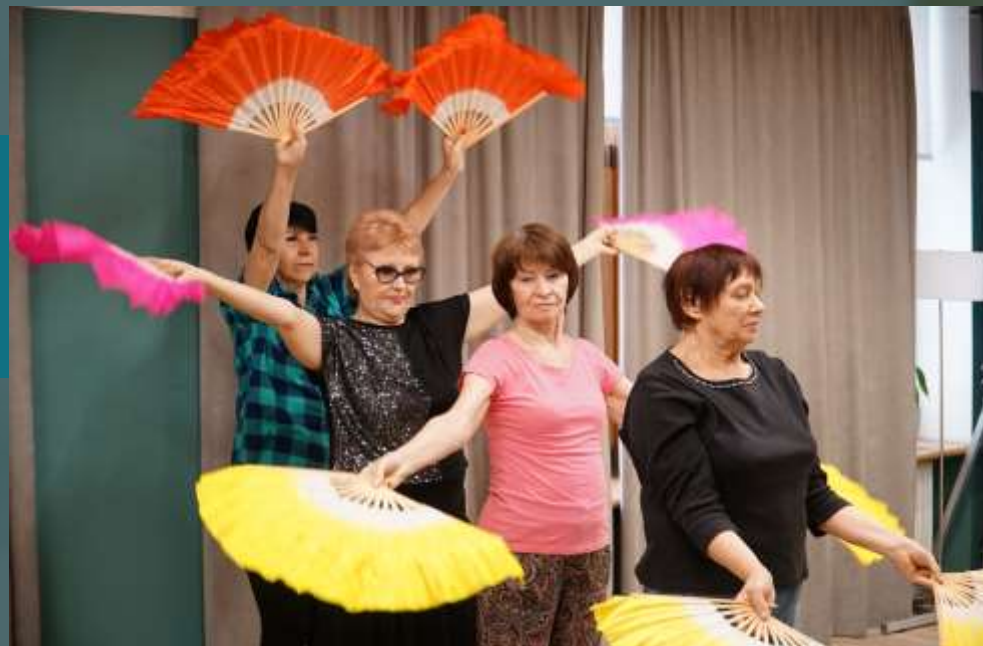
ЦМД «Якиманка» 3-й Кадашевский переулок, 9

В 2023 году в районе Якиманка работает 1 центр московского долголетия